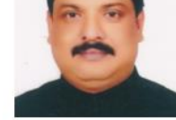
জশাব শরীফ আহমেদ এম.পি